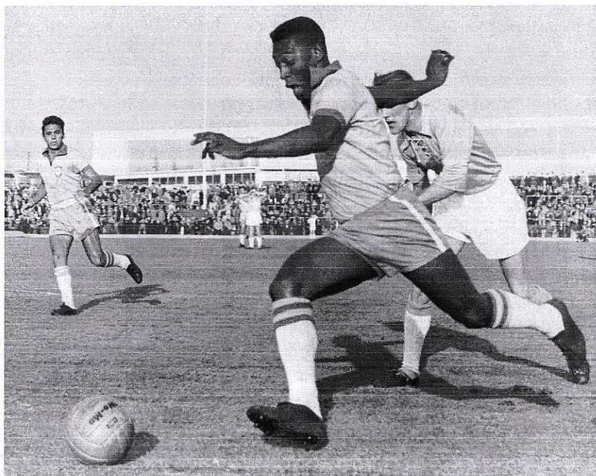
Pelé (Suedia - Brazilia 1-7/1960)

C el mai mare? Treaba pământenilor pedanți și perdanți! Pelé a fost deasupra. O observație discutabilă, dar nu imposibilă spune că toți ceilalți patru contracandidați îi sunt subcapitole. Căci Pelé a avut eleganța patriciană și viziunea spațială post-geometrică care au trecut în Di Stéfano și, apoi, în Cruyff. Și explozia prelungită care ni l-a dat pe Maradona. Și controlul magic-magnetic din care a apărut relația siameză Messi-minge. De altfel, singura comparație care merită contemplația duce la un alt supra-natural: Cassius Clay (mai târziu, Muhammad Ali). Misterul care îi unește e desăvârșirea athletică a corpului și echilibrul permanent în orice regim de mișcare.